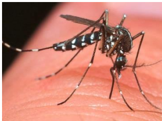
Tigermücke überträgt das Zika Virus

https://osir.ch/schwanger-auf-reisen-thailand-oder-tessin/