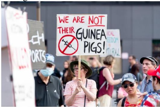
«Wir sind nicht deren Versuchskaninchen»: Protest von Impfkritikern in New York.

Das Thema ist sehr aktuell angesichts der Covid-19 Impfgegnern. Den Leuten zu verstehen geben, dass sie jederzeit vorbeikommen können für weitere Beratungen. Verweis auf Artikel im Tagi 12.8.21